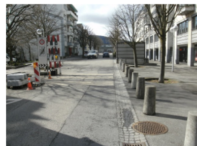
Übergangszone 20 in 30 mit