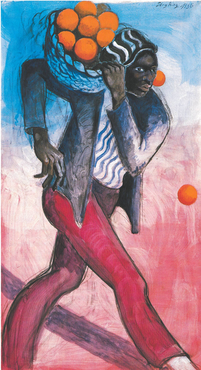
«Moro-Orangen», 1985, Acryl

ordnet, geheimnisvoll und rätselhaft in ihrem Tun.